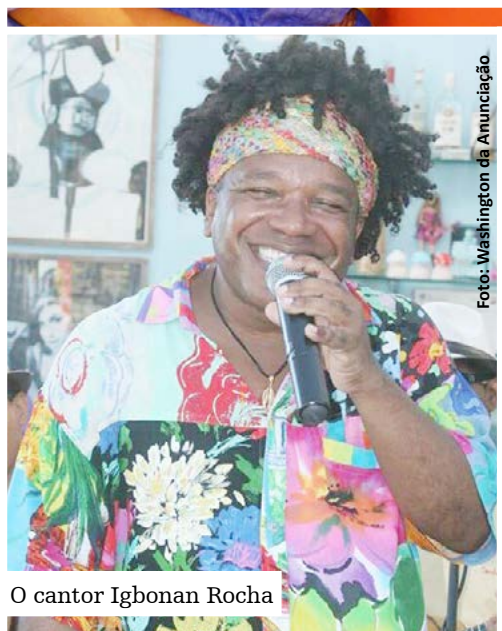
O cantor Igbonan Rocha